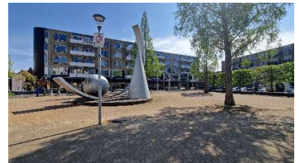
Plein voorzijden winkelruimten