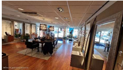
In verhuurde staat