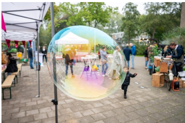
Foto impressie van de burendag